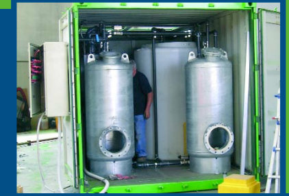
TRAITEMENT TERTIAIRE DES EAUX USEES POUR BASE-VIE DE 50 m³/j Arabie Saoudite