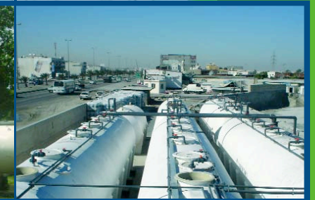
TRAITEMENT DES EAUX USEES DE 300 m³/j Bahrain