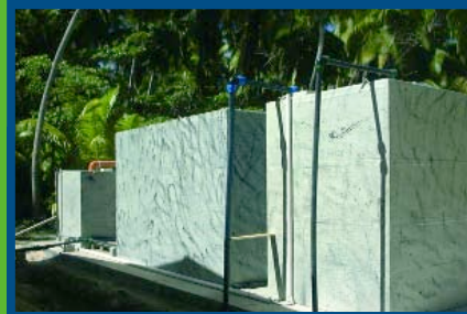
TRAITEMENT DES EAUX USEES URBAINES INSTALLATION A BOUES ACTIVEES DEBIT: 10 A 50 m³/j Seychelles