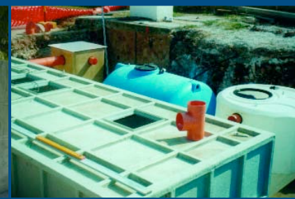
TRAITEMENT DES EAUX USEES URBAINES DEBIT: 10 A 60 m³/j Croatie