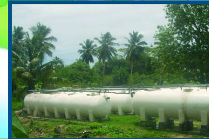
EXTENSION DE L'INSTALLATION DE TRAITEMENT DES EAUX USEES 300 m³/j Nigeria