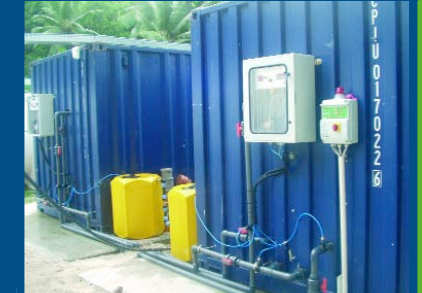
TRAITEMENT DES EAUX USEES POUR BASE-VIE DE 100 m³/j Algerie