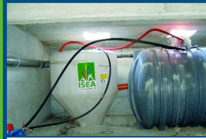
SYSTEME A BOUES ACTIVEES FAIBLE CHARGE 30 m³/j France