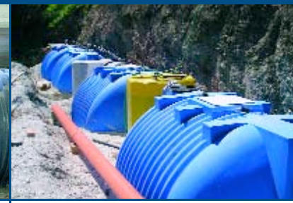
SYSTEME A BOUES ACTIVEES FAIBLE CHARGE 40 m³/j Italie