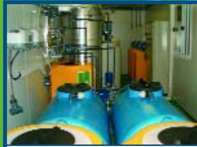
TRAITEMENT DES EAUX INDUSTRIELLES D'ORIGINE ALIMENTAIRE Italie