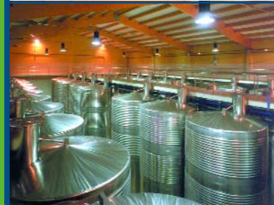
TRAITEMENT DES EAUX USEES POUR CAVES VINICOLES Spain